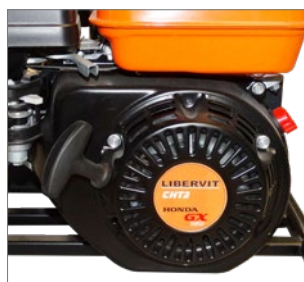
moteur à essence