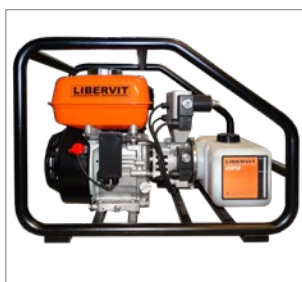
utilisation pour 3 heures de travail intensif

Tous nos outils sont équipés de raccord anti-pollution à fixation rapide.