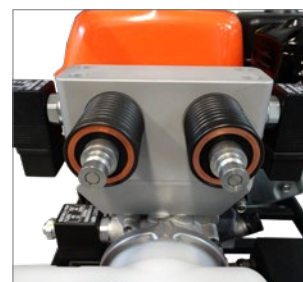
2 connecteurs hydrauliques