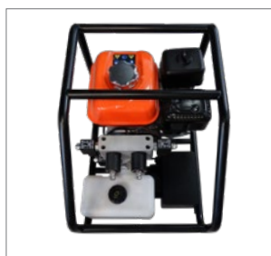
centrale hydraulique à moteur thermique CHT2