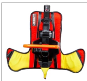
claie de portage souple CLS/E500

La claie de portage de l'écarteur E500 est dotée d'un logement permettant de recevoir une élingue de sécurité, une étiquette ou une sérigraphie indique que le logement est destiné aux élingues de sécurité