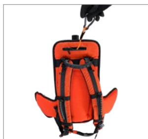
Logement d'élingue de sécurité