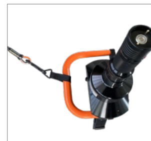
arrimage avec l'élingue de sécurité