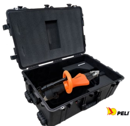
en option, valise de transport PELICASE®