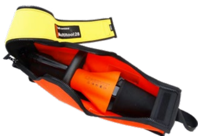
Multitool28 livré avec son sac de transport, réf. ST/M28