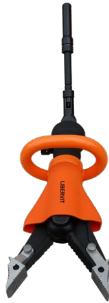
ÉCARTEUR / CISAILLE